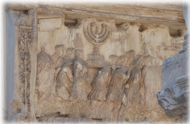
The arch of Titus

Based on Likutei Sichos Vol. 21 pages 164-172 and others