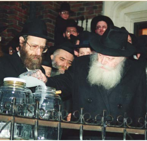
הרבי בשאיבת 'מים שלנו'. תש"נ

הכורך. לכן, אם צריכים לדבר על נושא שאינו קשור לסעודה, יש לעשות זאת לפני נטילת ידיים או אחרי סיום אכילת הכורך. רצוי להזכיר זאת לבני הבית לפני שניגשים לנטילת ידיים.