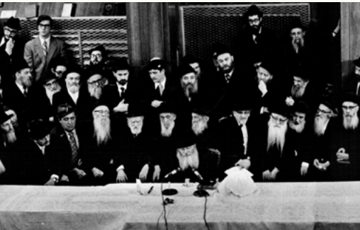
התוועדות י"א ניסן. תשמ"ד

בעמדנו ימים אחדים לפני חג הפסח (כאמור לעיל) - הרי (כמדובר כמ"פ, וגם בכתב ובדפוס) דבר טוב ונכון ביותר שישתדלו בחלוקת מצה שמורה, לאלו שאין להם מצד עצמם, לכל-הפחות ה"כזיתים", ומה טוב - מצה אמצעית, ומה טוב - שלוש מצות.