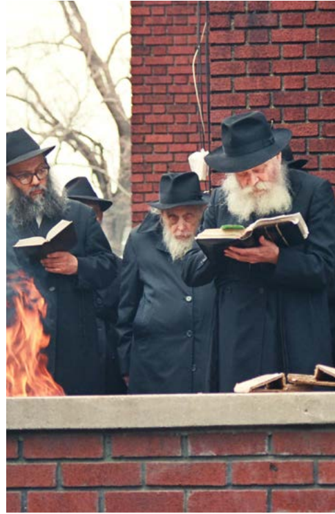
הרבי בביעור חמץ. תשמ"ד

בבתים משותפים (בנייני מגורים) – החובה לבדוק