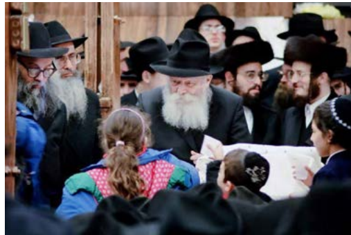
מוציא אחרון של פסח. תש"נ